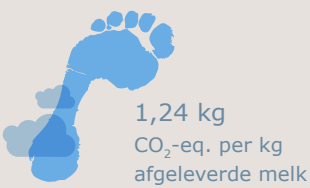
CO 2 -voetafdruk