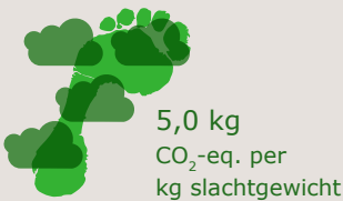
CO 2 -voetafdruk

15% van fosfaatoverschot in varkensmest geëxporteerd in 2012